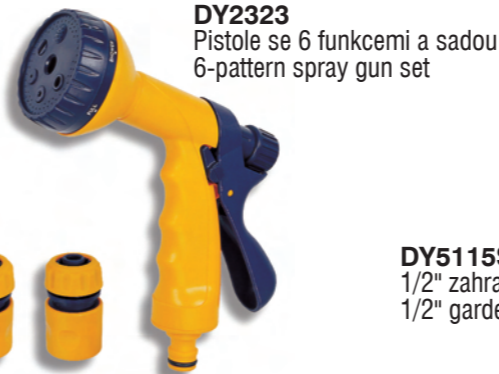
DY2323 Pistole se 6 funkcemi a sadou 6-pattern spray gun set