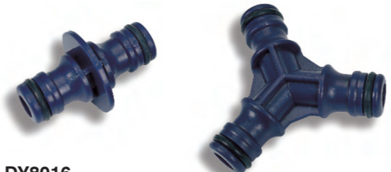
DY8016 Adaptér pro 2 rychlospojky Two-way hose coupling