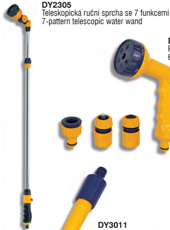
DY2305 Teleskopická ruční sprcha se 7 funkcemi 7-pattern telescopic water wand