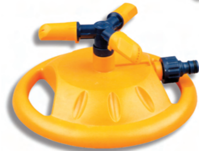
DY6013 3 ramenný rotační zavlažovač na podstavci 3-arm revolving sprinkler on base