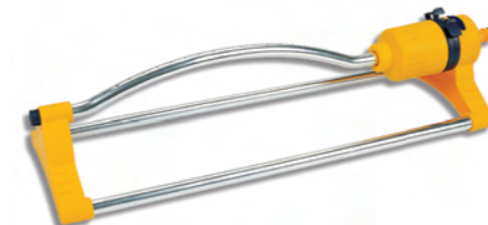
DY7030 Plastový zavlažovač s 19 tryskami Oscillating sprinkler 19 holes