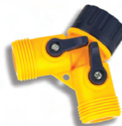
DY8002 Rozdvojka Y-Switch coupling with swivel