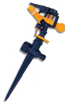
DY1013 Impulsní zavlažovač s hrotem Plastic impulse sprinkler with spike