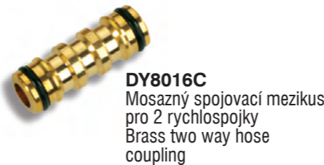
DY8016C Mosazný spojovací mezikus pro 2 rychlospojky Brass two way hose coupling