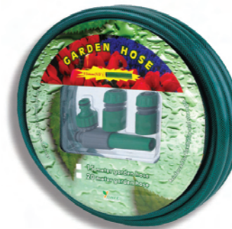
DY5115S 1/2" zahradní sada, délka hadice 15 m 1/2" garden hose set 15 m