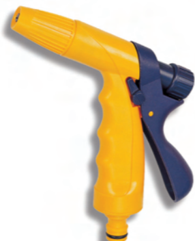
DY2021 Nastavitelná pistole Adjustable spray gun