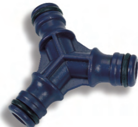
DY8015 Adaptér pro 3 rychlospojky Three-way hose coupling