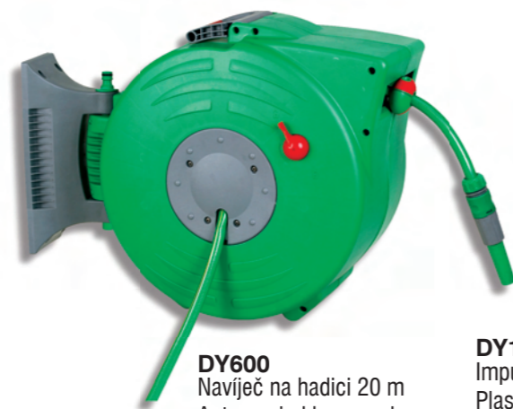
DY600 Navíječ na hadici 20 m Auto rewind hose reel