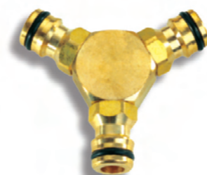
DY8015C Mosazný spojovací mezikus pro 3 rychlospojky Brass three way hose coupling