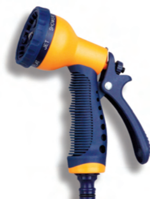
DY2077 Pistole se 7 funkcemi 7-pattern spray gun