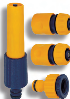
DY8025 Hadicová postřikovací sada Hose basic set