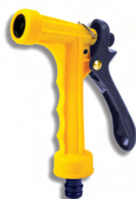
DY2073 Postřikovací pistole Plastic spray nozzle