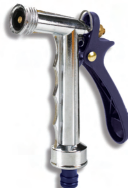
DY2073Z Kovová rozprašovací pistole Metal spray nozzle