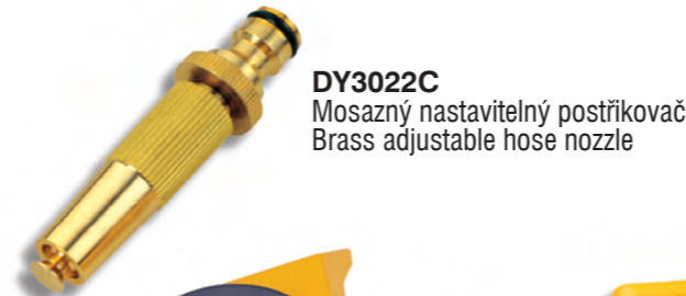
DY3022C Mosazný nastavitelný postřikovač Brass adjustable hose nozzle