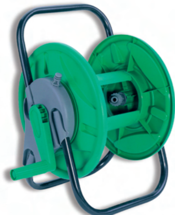
DY670 Přenosný navíječ na hadici Hose reel