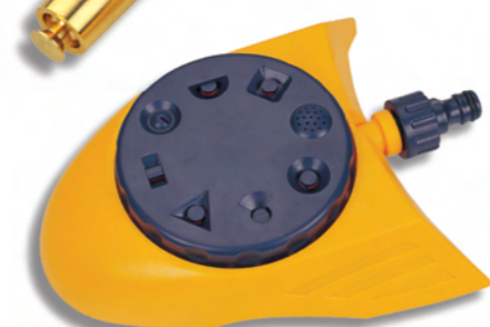
DY6011 Zavlažovač s 8 funkcemi a adaptérem 8-pattern stationary sprinkler