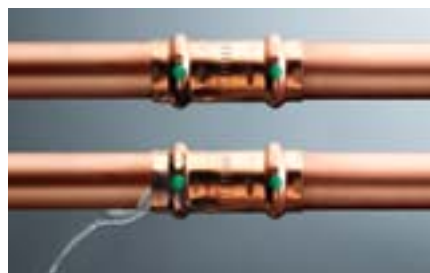
Nahoře: po zalisování těsné. Dole: viditelně nezalisované.

Stále více odborných řemeslníků vsází na inovativní lisovací techniku Viega ze správných důvodů. Protože kromě maximální spolehlivosti přináší i nejvyšší míru časové úspory.