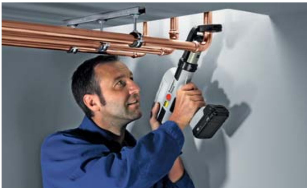
Práce bez zanechání stop: S lisovacími nástroji Viega se bez námahy dostanete i na ta nejméně přístupná místa a nezanecháte po sobě nikde stopy.

■ Vhodná pro montáž v obtížně přístupných instalacích, např. při rekonstrukcích