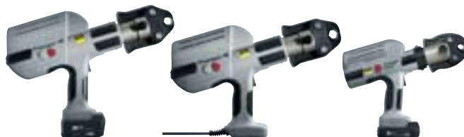
Lisovací nástroje Viega: Pressgun 4B, 4E a Picco.

Podstatou systému je světoznámá lisovací technologie Viega s SC-Contur. Tato technologie zaručuje spolehlivost a flexibilitu. Sortiment lisovacích spojek Viega totiž zahrnuje rozmanité varianty instalací a připojení, a to i ve velkých rozměrech. Nabízí mimořádně široký program praktických řešení s velkým výběrem nejrůznějších lisovacích spojek: K dostání jsou oblouky, kolena, nadoblouky, T kusy, závitové přechody, hrdla, šroubení, stejně jako armatury s lisovacím připojením.